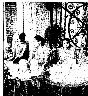
Auf dem Markt